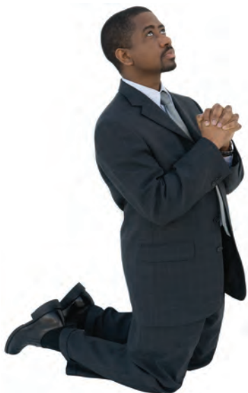
Dios perdonará cualquier pecado que yo le confiese a Él.