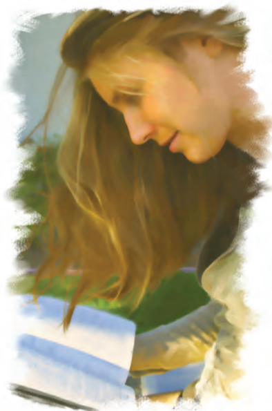
El Espíritu Santo guía a las personas a las verdades bíblicas.

Respuesta: La obra del Espíritu Santo es convencerme de pecado y guiarme a toda verdad. El Espíritu Santo es la agencia de Dios para la conversión. Sin el toque del Espíritu Santo, nadie siente dolor por el pecado, y nadie se convertiría.