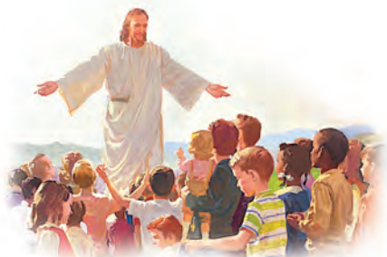
Jesús ama a los habitantes de la tierra con un amor eterno.

Respuesta: Jesús nos ama a todos con un amor indescriptible y sin falla, que supera todo entendimiento.