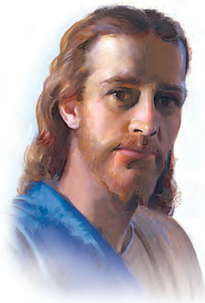
Jesús es el autor de Las Escrituras.

Respuesta: El Dios de la Biblia (aún del Antiguo Testamento), es virtualmente el mismo Jesucristo. Jesús creó el mundo (Juan 1:1-3, 14; Colosenses 1:13-17), escribió los Diez Mandamientos (Nehemías 9:6, 13), era el Dios de los Israelitas (1 Corintios 10:1-4), y guió los escritos de los profetas (1 Pedro 1:10,11). Así que, Jesucristo es el autor de las Escrituras.