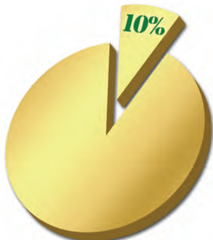
La palabra “diezmo” literalmente significa “décimo”

Respuesta: El diezmo le pertenece a Dios.