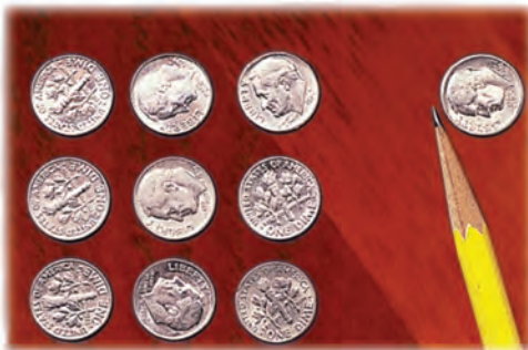
La décima parte del ingreso de una persona pertenece a Dios.