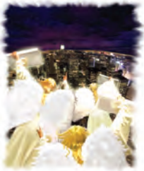
El remanente de Dios deberá predicar el mensaje de los tres ángeles a todo el mundo.

A. El juicio de Dios ha comenzado. ¡Adoradle a Él! La iglesia de Dios del fin tiene que estar predicando que el Juicio comenzó en 1844 (vea las Guías de Estudio números 18 y 19). También llamará a la gente a “adorar Aquel que hizo el cielo y la tierra, el mar y las fuentes de las aguas” (Apocalipsis 14:7). ¿Cómo adoramos a Dios como Creador? Dios escribió la respuesta en el cuarto mandamiento.