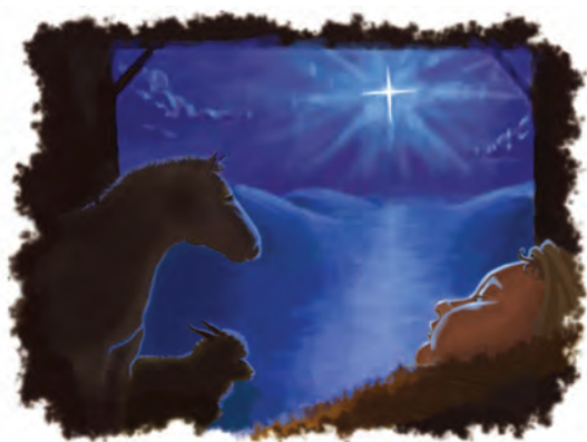
El bebé mencionado en Apocalipsis 12 es Jesús.

Respuesta: El hijo varón era Jesús. Él algún día gobernará a todas las naciones con vara de hierro (Apocalipsis 19:13-16; Salmos 2:7-9). Jesús, quien fue crucificado por nuestros pecados, fue resucitado de los muertos y ascendió al cielo (Hechos 1:9-11). Su poder de resurrección, manifestado en nuestras vidas, es uno de los dones esenciales de Jesús para su pueblo (Filipenses 3:10).