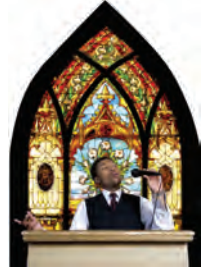
A menos que una iglesia esté predicando el mensaje de los tres ángeles mundialmente, ésta no puede ser la iglesia remanente de Dios del fin del tiempo.

C. No adore a la bestia ni reciba su marca, la cual es observar el domingo, como día santo. Está apercibido acerca de cualquier engaño.