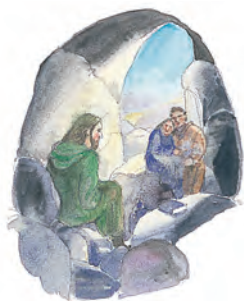
El pueblo de Dios huyó a lugares solitarios de la tierra para escapar de la persecución.