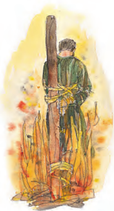
Millones fueron quemados en la estaca por la persecución de Satanás.

En Apocalipsis capítulos 12 y 14, Jesús nos provee seis puntos descriptivos para identificar a su iglesia de los últimos días. Identifíquelos al estudiar el resto de esta Guía de Estudio.