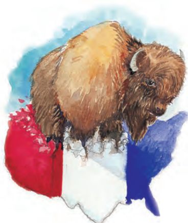
La bestia de Apocalipsis 13:11-18 Simboliza a los Estados Unidos de Norteamérica.

Respuesta: La cautividad papal mencionada en el versículo 10 se llevó a cabo en 1798, y el nuevo poder (versículo 11) apareció al mismo tiempo. Los Estados Unidos de América declararon su independencia en 1776, y la Constitución se votó en 1787; se adoptó la Declaración de Derechos en 1791, y fueron claramente reconocidos como un poder mundial para el año 1798. La fecha obviamente le cae perfectamente con Estados Unidos de Norteamérica. Ningún otro poder califica.