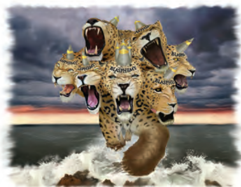
La bestia de Apocalipsis 13:1-10 simboliza el papado.

Respuesta: La bestia con siete cabezas (Apocalipsis 13:1-10) es ni más ni menos, el papado romano. (Vea la Guía de Estudios número 15 para un estudio completo sobre este tema.) Recuerde que las bestias en las profecías bíblicas simbolizan naciones o poderes mundiales (Daniel 7:17,23).