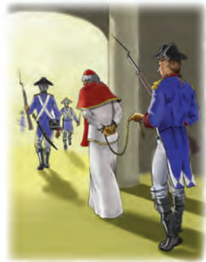
En 1798, el General Berthier infligió una herida mortal al papado cuando llevó cautivo al Papa.

Respuesta: La Biblia predijo que el papado perdería su influencia y poder mundial al final de los 42 meses. Esta profecía se cumplió en 1798, cuando el General de Napoleón, Alejandro Berthier tomó al Papa cautivo y el poder papal recibió una herida mortal. (Para detalles completos, vea la Guía de Estudio número 15).