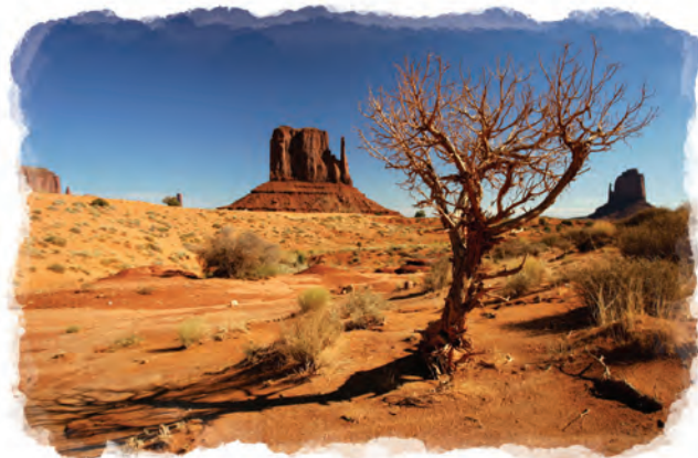
La profecía predijo que los Estados Unidos surgirían de un área poco poblada.

(Apocalipsis 17:15). Por lo tanto, la tierra representa lo opuesto. Significa que esta nueva nación se levantaría en un área del mundo poco habitada antes del 1700. No podía surgir de las naciones en contienda o sobre regiones habitadas del Mundo Antiguo. Tenía que surgir en un continente poco habitado.