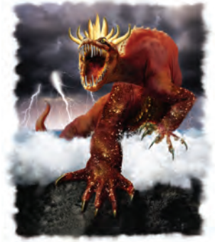
La bestia del capítulo 13 de Apocalipsis simboliza al Anticristo.

I. Hace guerra y vence a los santos (versículo 7). J. Reina por 42 meses (versículo 5). K. Tiene un número misterioso—666 (versículo 18). ¿Suenan familiares algunos de estos puntos? ¡Claro que sí! Nos encontramos con varios de ellos cuando estudiamos sobre el Anticristo en el capítulo 7 de Daniel. La “bestia” de Apocalipsis 13 es simplemente otro nombre para el “Anticristo” (algo que aprendimos en Daniel 7), que es el mismo papado. Las profecías de Daniel y del Apocalipsis con frecuencia cubren el mismo terreno que algunas profecías anteriores, pero cada vez se agregan nuevas características para aclarar más las profecías. Por lo tanto, espere aprender nuevas cosas acerca del Anticristo en esta Guía de Estudio. Consideremos, uno por uno, los 11 puntos que describen a la bestia.