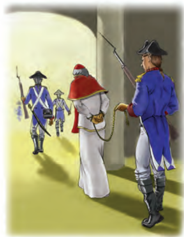
El General Berthier infligió una herida mortal al papado cuando tomó cautivo al Papa Pío VI.

Apocalipsis 17 y 18, en donde las iglesias caídas son representadas por una madre caída y por sus hijas caídas.) La mujer pura es representada como encinta a punto de dar a luz. El dragón está esperando devorar al niño a su nacimiento. Sin embargo, cuando nace el niño, evade al dragón, cumple su misión, y asciende al cielo. Obviamente se refiere al niño Jesús, a quien Herodes intentó destruir al matar a todos los bebés en Belén (Mateo 2:16). Por lo tanto, el dragón representa a la Roma pagana, de la cual Herodes era rey. El poder detrás del plan de Herodes era por supuesto, el diablo (Apocalipsis 12:7-9). Satanás actúa por medio de varios gobiernos para llevar a cabo su terrible labor— en este caso, la Roma pagana.