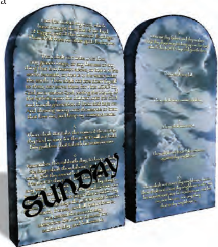
Cambiar el Sábado por el domingo es alterar la ley de Dios—esto es algo muy serio.