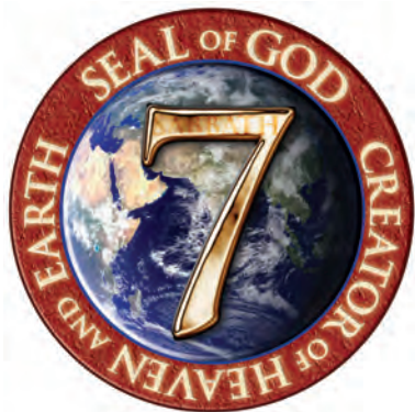
El Sábado es la señal, marca del poder de Dios.

“Y les di también mis días de reposo, para que fuesen por señal entre mí y ellos, para que supiesen que yo soy Jehová que los santifico” (Ezequiel 20:12). “Señal es para siempre entre mí y los hijos de Israel; Porque en seis días hizo Jehová los cielos y la tierra, y en el séptimo día cesó y reposó” (Éxodo 31:17).