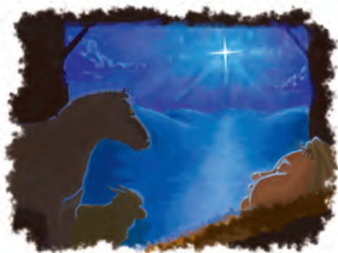
El rey Herodes intentó “devorar”, o matar a Jesús cuando nació.

dicho: “En cierto aspecto, ella (el papado) ha copiado su organización del Imperio Romano, ha conservado y hecho fructífero los conocimientos filosóficos de Sócrates, Platón y Aristóteles, adquiridos tanto de bárbaros como del Imperio Romano Bizantino, aunque siempre se mantiene de una manera autónoma, consolidando todos los elementos recibidos de fuentes externas.” 1 Este punto encaja perfectamente con el papado.