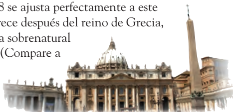
El “cuerno pequeño” de Daniel, capítulo 8 representa a Roma tanto en su etapa pagana como papal. Por tanto el cuerno pequeño de los últimos días es el papado.