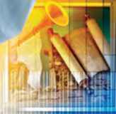
457 B.C. Decreto para Reconstruir Jerusalén