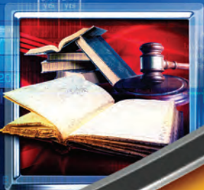
A.D. 1944 Biblia de Jerusalén