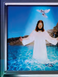
A.D. 27 Bautismo de Jesús