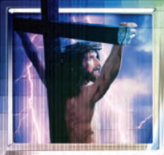
A.D. 31 Crucifican a Jesús