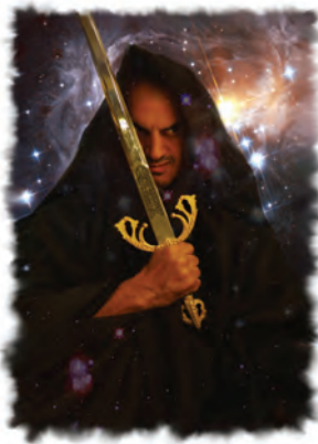
Satanás es el causante de todo pecado.

Pero, ¡no!, Jesús, el Hijo de Dios —Dios mismo—un Ser superior a la suma de toda la humanidad que jamás llegara a existir en la tierra, estuvo dispuesto a entregar su vida en sacrificio para pagar la deuda de muerte por todos los pecadores (1 Corintios 5:7). Al aceptar su sacrificio, todo pecador estará libre de la condenación del pecado