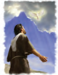
El bautismo de Jesús fue un claro cumplimiento de la profecía Bíblica.