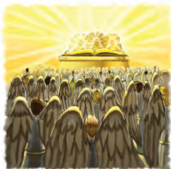
Las huestes celestiales son testigos del juicio investigador de Dios.

Respuesta: Quedaban 1,810 años restantes ( 2,300 - 490 = 1,810 ). La fecha final de la profecía es 1844 ( 34 \text{ a.C.} + 1810 = 1844 ). El ángel le dijo a Daniel que el santuario celestial sería purificado, o que el juicio celestial comenzaría en esa fecha. (El santuario terrenal fue destruido en el año 70 d.C.) Aprendimos en la Guía de Estudio número 17 que el día celestial de expiación, o juicio, estaba programado para el fin del tiempo. Ahora sabemos que la fecha del comienzo del juicio es el año 1844. Dios fijó esta fecha. Es tan cierto como la fecha del 27 d.C. que indicaba que Jesús era el Mesías. El pueblo de Dios en este tiempo final debe estar anunciando esta gran verdad (Apocalipsis 14:6, 7). Usted se sentirá emocionado y satisfecho al aprender los detalles del juicio al trabajar con la Guía de Estudios número 19. En los días de Noé, Dios declaró que el juicio del diluvio vendría en 120 años (Génesis 6:3)—así sucedió. En el tiempo de Daniel, Dios declaró que su juicio del tiempo del fin empezaría en 2,300 años (Daniel 8:14)—y esto se cumplió. El juicio de Dios del tiempo del fin ha estado en sesión desde 1844.