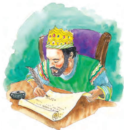
El rey Artajerjes autorizó la restauración de Jerusalem en el año 457 a.C.

Respuesta: El evento que marcó el punto de partida fue el decreto del Rey Artajerjes de Persia, que autorizaba al pueblo de Dios (que permanecía cautivo en Medo-Persia) a regresar a Jerusalén y restaurar la ciudad. El decreto que se encuentra en Esdras 7 fue emitido en el año 457 a.C.—el séptimo año del rey (versículo 7)—fue implementado en el otoño de ese mismo año. (Artajerjes comenzó su reinado en el 464 a.C.).