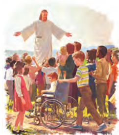
El libro de Apocalipsis revela a Jesús en una manera única.

Nota: Antes de continuar, por favor abra su Biblia y lea Apocalipsis 14:6-14.