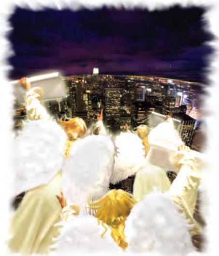
Dios usa ángeles para simbolizar Su último triple mensaje.

Respuesta: La palabra “ángel” literalmente significa “mensajero,” así que es adecuado que Dios utilice tres ángeles para simbolizar la predicación del evangelio por medio un mensaje tripartito para los últimos días. Dios utiliza el simbolismo de ángeles para recordarnos el poder sobrenatural que acompañará a estos mensajes.