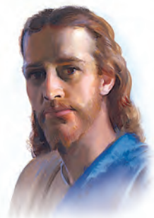
El mensaje de los tres ángeles se centra en Jesús.