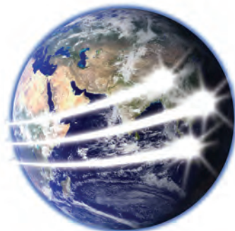
El mensaje de esperanza que Dios tiene para el último tiempo deber ser llevado a cada persona en la tierra.

Aunque son muchos los engaños de Satanás, hay dos que son muy efectivos: (1) Salvación por obras, y (2) salvación en el pecado. Estos dos engaños son descubiertos y revelados en los mensajes de los tres ángeles. Muchos, sin darse cuenta, han aceptado uno de estos dos errores y están tratando de confiar su salvación en uno de ellos: una hazaña imposible. También debemos enfatizar que nadie que no esté proclamando el mensaje de los tres ángeles, estará verdaderamente predicando el evangelio de Jesús para los últimos tiempos.