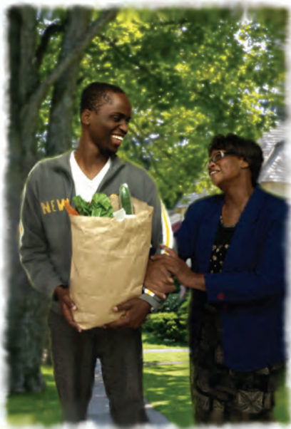
Aquellos que dan reverencia a Dios encontrarán gran gozo en servirle.

El evangelio incluye el mensaje de la creación y la redención del mundo por el Señor Dios del cielo. Adorar al Creador incluye alabarlo en el día que él apartó en memoria de la creación (el Sábado, el séptimo día). La referencia que se hace en Apocalipsis 14:7 al sábado es aclarada por el hecho que las palabras “hizo el cielo, la tierra y el mar” fueron extraídas directamente del mandamiento del Sábado (Éxodo 20:11) y utilizadas aquí. (Vea la Guía de Estudios número 7 para más información sobre el Sábado). Nuestras raíces mismas se encuentran únicamente en Dios, quien en el principio nos hizo a su imagen. Aquellos que no alaban a Dios como el Creador—no importa qué otra cosa alaben—nunca descubrirán su verdadero origen.