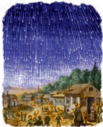
La gran lluvia de estrellas ocurrió el 13 de noviembre de 1833.

* Peter A. Millman, “The Falling of the Stars” [La caída de las estrellas], The Telescope (Mayo-Junio, 1940), p. 57.