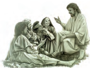
Jesús enseñó que regresará a la tierra por segunda vez.