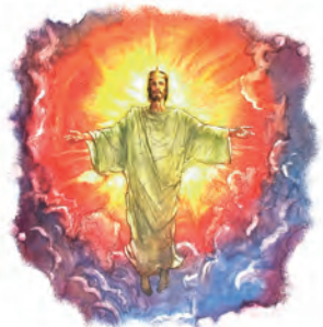
Jesús dijo que regresará a la tierra sobre las nubes.

Respuesta: Las Escrituras prometen que Jesús regresará a esta tierra de la misma manera en que se fue en ocasión de su ascensión; de una manera visible, literal, corporal, personal. S. Mateo 24:30 dice: “Verán al Hijo del Hombre viniendo sobre las nubes del cielo con poder y gran gloria”. El vendrá literalmente en las nubes, como ser personal con un cuerpo de carne y huesos (S. Lucas 24:36-43, 50-51), y su venida será visible. La Escritura es definida en estos hechos.