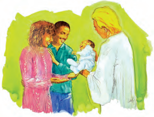
Las pequeñas criaturas que murieron les serán devueltas a sus padres cuando Jesús regrese.

Respuesta: Jesús regresa a esta tierra para recompensar a su pueblo según lo prometió, y para llevar a sus hijos al hermoso hogar que él ha ido a preparar para ellos. El les restituirá a sus hijos todos los gozos y placeres que Adán y Eva perdieron por el pecado. Su segunda venida pondrá fin a la presente era de maldad.