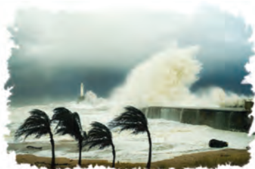
El temor y el pavor al futuro son señales del regreso de Jesús.