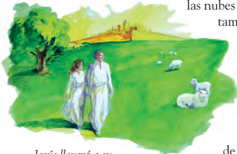
Jesús llevará a su pueblo al cielo y les devolverá todo lo que Adán y Eva perdieron.

Respuesta: Los muertos justos serán resucitados, recibirán cuerpos inmortales como el de Cristo, y serán arrebatados en las nubes para recibir al Señor. Entonces los justos vivos también recibirán cuerpos semejantes al de Cristo, y serán arrebatados para recibir al Señor en el aire. Y Jesús llevará a los justos consigo al cielo. Nótese que Jesús no toca la tierra en su segunda venida. Los santos lo reciben “en el aire”. Por eso los hijos de Dios no prestarán atención a cualquier rumor o informe de que Cristo está en Nueva York, en la ciudad de México, etcétera. Aparecerán falsos Cristos y harán milagros sobre la tierra (S. Mateo 24:23-27), pero Jesús permanecerá en las nubes por encima de la tierra en su segunda venida.