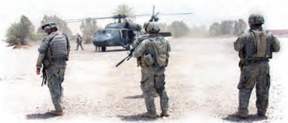
Disputa entre naciones es señal de la segunda venida de Jesús.

Guerras y los estragos de contiendas civiles afectan a miles de personas alrededor del mundo. Sólo la pronta venida de Jesús pondrá fin al dolor y la destrucción de las guerras.