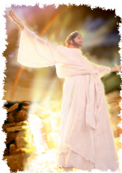
El sábado no fue cambiado por el domingo con la resurrección de Jesús.

B. Cristo esperaba que su pueblo continuara guardando el sábado en el año 70 d.C., cuando Jerusalén fue destruida. Sabiendo demasiado bien que Jerusalén sería destruida en el año 70 d.C., Jesús amonestó a sus seguidores de ese tiempo, diciendo: “Orad, pues, que vuestra huida [de Jerusalén] no sea en invierno ni en sábado” (S. Mateo 24:20). Jesús hizo claro que él esperaba que el sábado fuera guardado aun cuarenta años después de su resurrección. De hecho, ninguna insinuación de un cambio se hace en ningún lugar de las Escrituras.