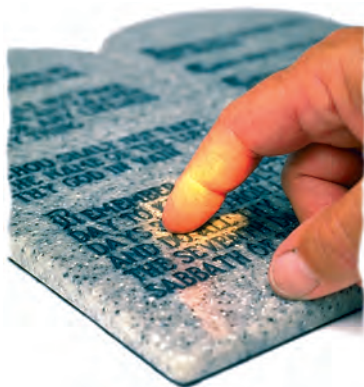
Dios escribió el mandamiento del sábado con su propio dedo.

“Acordarte has del día del reposo para santificarlo: seis días trabajarás, y harás toda tu obra; mas el séptimo día será reposo para Jehová tu Dios: no hagas en él obra alguna, tú, ni tu hijo, ni tu hija, ni tu siervo, ni tu criada, ni tu bestia, ni tu extranjero que está dentro de tus puertas: porque en seis días hizo Jehová los cielos y la tierra, la mar y todas las cosas que en ellos hay, y reposó en el séptimo día: por tanto Jehová bendijo el día del reposo y lo santificó” (Exodo 20:8-11). “Y dióme Jehová las dos tablas de piedra escritas con el dedo de Dios” (Deuteronomio 9:10).