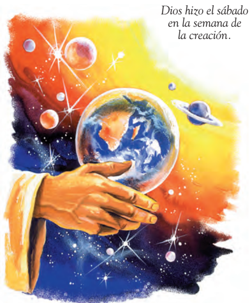
Dios hizo el sábado en la semana de la creación.

Respuesta: Dios apartó el sábado en la creación, cuando hizo el mundo. Descansó el sábado, y bendijo ese día y lo santificó.