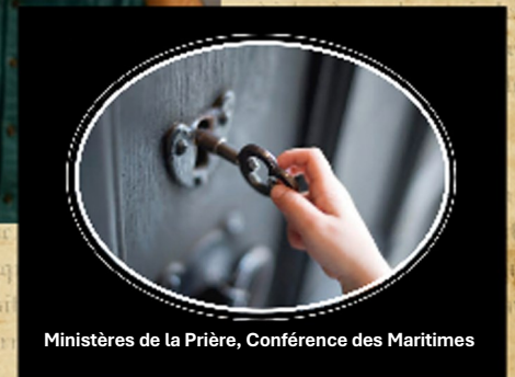
Ministères de la Prière, Conférence des Maritimes