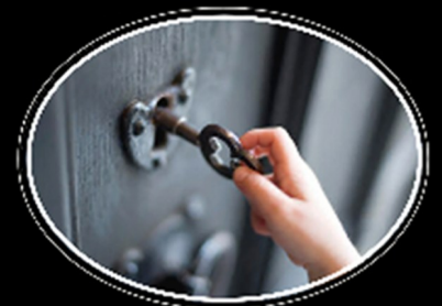
Ministères de la Prière, Conférence des Maritimes

Mais... Peut-on lui faire confiance pour le faire... pour moi ?