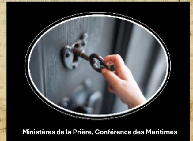
Ministères de la Prière, Conférence des Maritimes